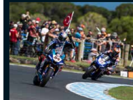
El turco Toprak Razgatlioglu se encaramó a lo más alto del podio en la pasada cita del campeonato WorldSBK en Phillip Island, Australia. Su equipo, el Pata Yamaha WSBK, cuenta con el apoyo de Ferodo Racing & Motorcycle Division.

Todos estos equipos, al igual que Ferodo Racing & Motorcycle Division, están pendientes de las medidas tomadas ante el Covid-19 que han provocado que todas las competiciones de la temporada 2020 hayan sido pospuestas de forma indefinida.