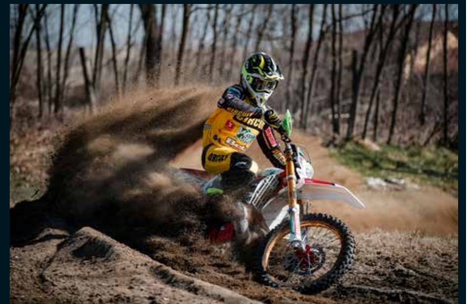
El Beta Boano Racing Team disputará el Campeonato de Enduro GP nada menos que con nueve pilotos.