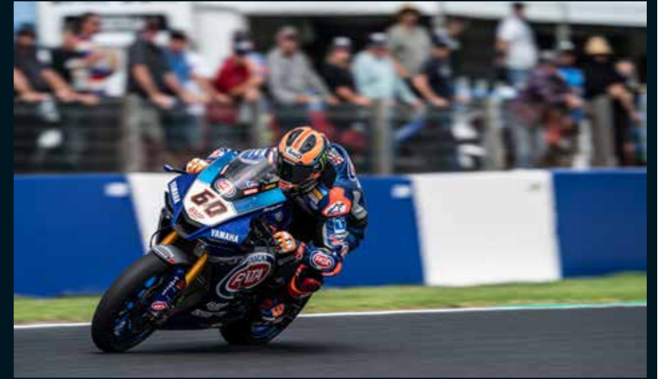
En la imagen, el piloto del equipo Pata Yamaha WorldSBK Team Michael van der Mark.